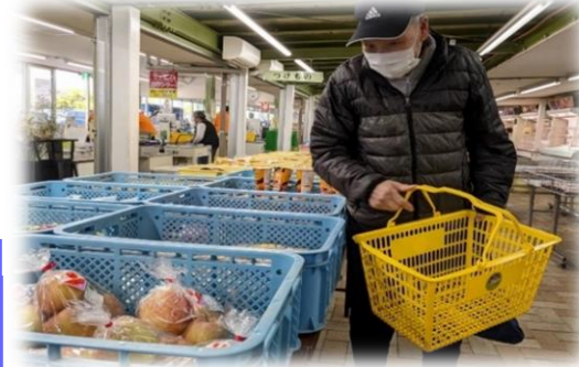
買い物も楽しめました