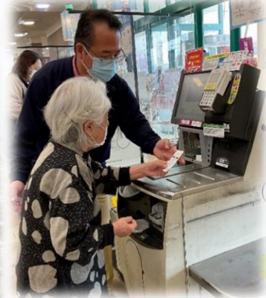
セルフレジも体験