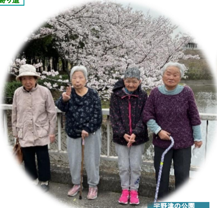
宇野津の公園 公園内をしっかりと 歩きました