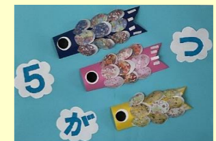
製作: 玄関カレンダー