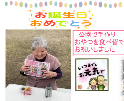
お誕生日 おめでとう