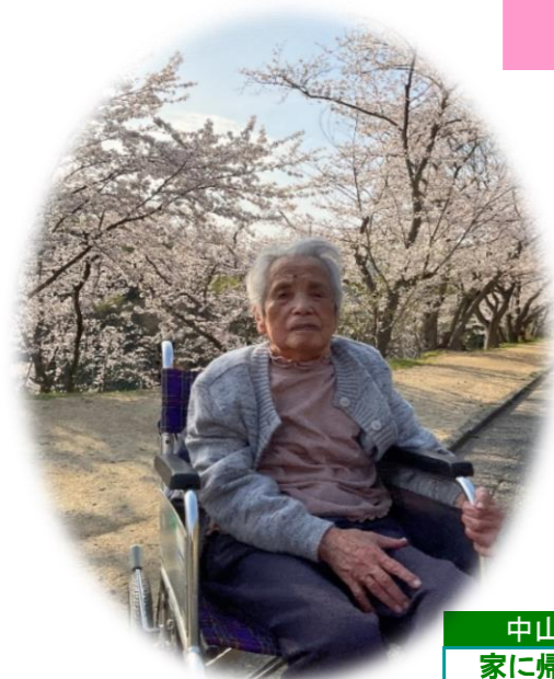
中山公園 家に帰る前に ちょっぴり寄り道