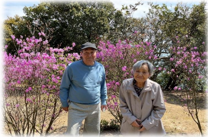
通仙園 桜とつつじ 両方楽しめました