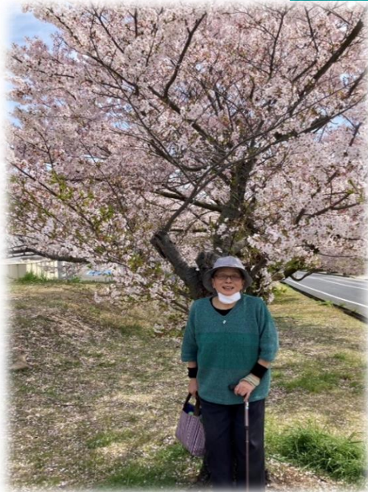
深山公園 お目当てのアナゴも たくさん買いました